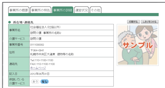
▲ 事業所情報が整理されているので読みやすい。

所在地や連絡先、提供されているサービスの内容など、利用するうえで知っておきたい様々な情報が表示されます。どの事業所を選べばよいか、検討するうえでの参考情報として活用できます。