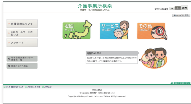
▲ 親しみやすいイラストで“見てわかる画面”に。