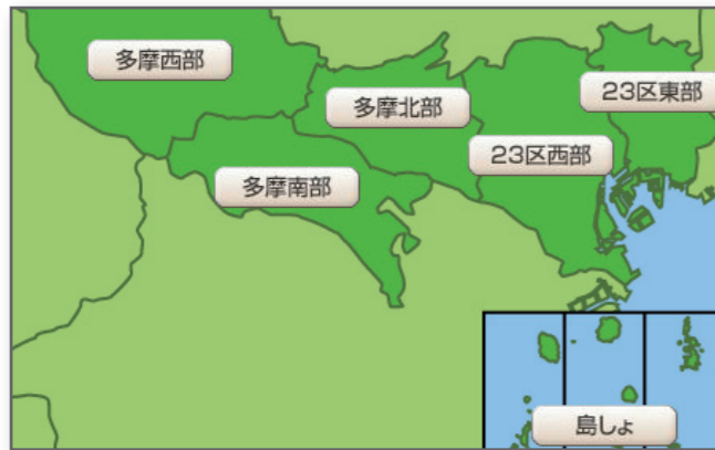
▲ 簡単な操作でラクラク検索。地図表示もできます。

インターネットの操作に不慣れな方も安心。知りたいサービスの種類やお住まいの地域などから、簡単に介護サービス事業所を探ることができます。