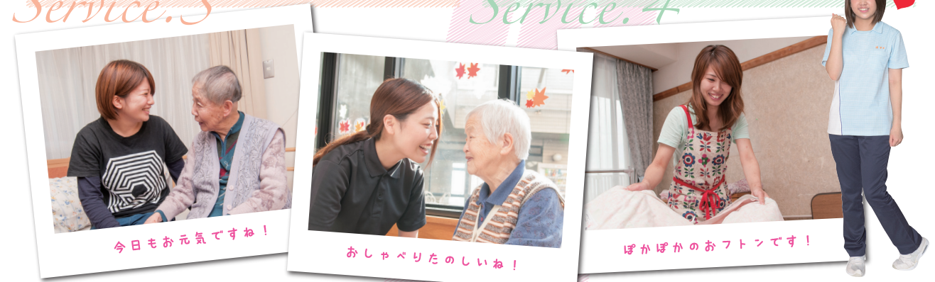
今日もお元気ですね！