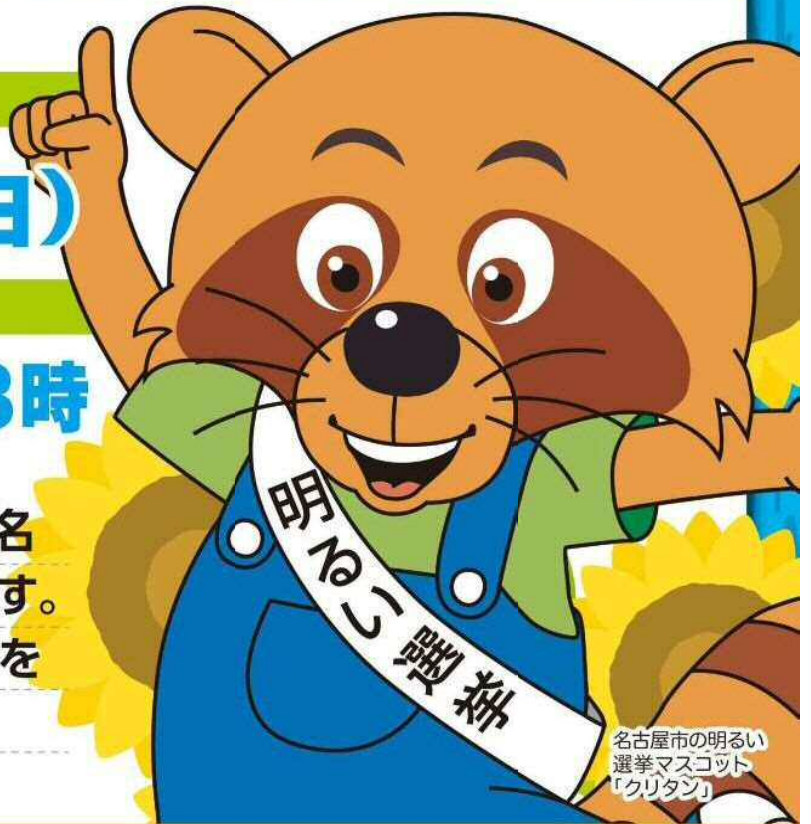
名古屋市の明るい選挙マスコット「クリタン」

比例代表選挙は候補者名 または政党名を記載します。 選挙区選挙は候補者名を 記載してください。