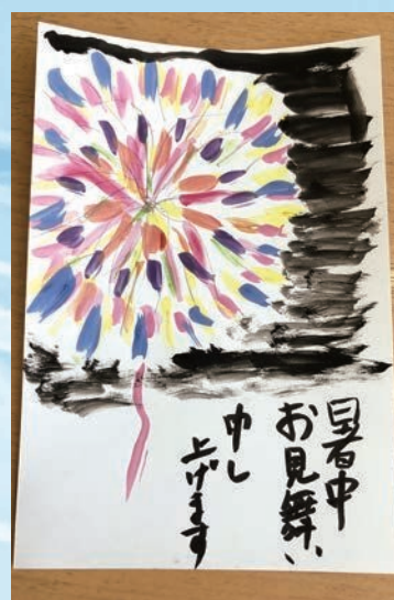
すずかけクリニックデイケア作品 さくひん