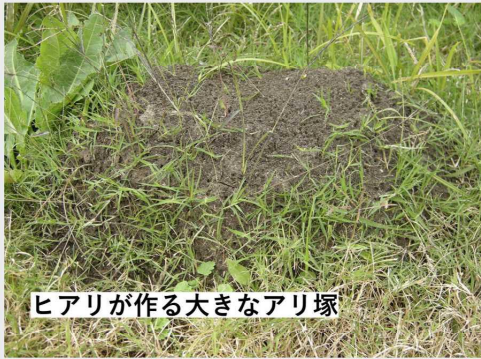
ヒアリが作る大きなアリ塚