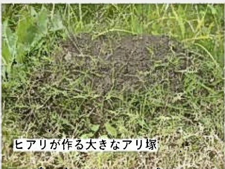
ヒアリが作る大きなアリ塚