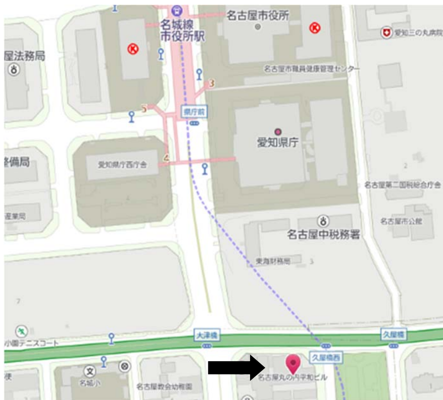
名古屋市介護事業者指定指導センター周辺地図

最寄駅等 地下鉄名城線:「市役所」又は「久屋大通」、市バス・基幹バス:「市役所」