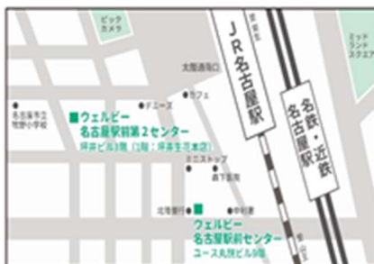
各線「名古屋」駅(太閤口) 徒歩6分

就労移行支援事業所 ウェルビー名古屋駅前第2センター TEL052-433-1020 FAX052-433-1021 名古屋駅太閤口徒歩6分