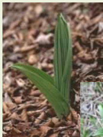
芽出し期の バイケイ ソウ