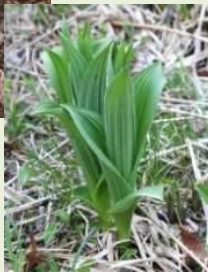
芽出し期 のコバイ ケイソウ