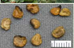
チョウセン アサガオの種