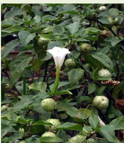
チョウセン アサガオの葉と花