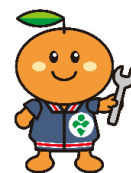
事業団マスコット キャラクター りはみん

＜主催・問い合わせ＞ 社会福祉法人名古屋市総合リハビリテーション事業団 なごや福祉用具プラザ 〒466-0015 昭和区御器所通3丁目12-1 御器所ステーションビル3F TEL: 052-851-0051 FAX: 052-851-0056