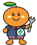
事業団マスコット キャラクター りはみん

＜主催・問い合わせ＞ 社会福祉法人名古屋市総合リハビリテーション事業団 なごや福祉用具プラザ 〒466-0015 昭和区御器所通3丁目12-1 御器所駅ビル3F TEL: 052-851-0051 FAX: 052-851-0056