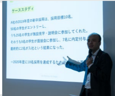
※昨年のプログラム時の様子です。今年はオンライン開催になります。