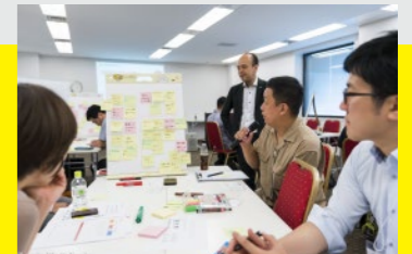
※昨年のプログラム時の様子です。今年はオンライン開催になります。