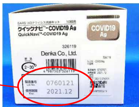
箱の側面に記載されています。