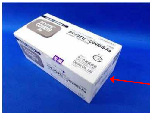
[大塚製薬販売品] 外箱写真