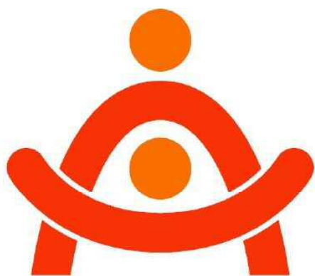
(参考) ロゴマークデザイン.

なお当該ロゴマークはA I C H Iのイニシャル「A」をモチーフに○を頭に見立て、介護従事者が介護し、介護対象者が元気に生活する姿をイメージし、有能な介護従事者を育成する事業所を表現したものです。○を頭に見立てて、上部が介護従事者で介護対象者を包み込んで、介護対象者が上を見上げ、大きく両腕を広げているイメージです。