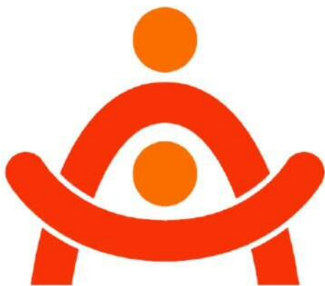
(参考) ロゴマークデザイン.

なお当該ロゴマークはA I C H Iのイニシャル「A」をモチーフに○を頭に見立て、介護従事者が介護し、介護対象者が元気に生活する姿をイメージし、有能な介護従事者を育成する事業所を表現したものです。○を頭に見立てて、上部が介護従事者で介護対象者を包み込んで、介護対象者が上を見上げ、大きく両腕を広げているイメージです。