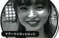
介護×管理栄養士 こはるさん