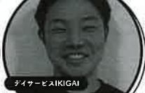
介護×理学療法士 きょうすけさん

介護×〇〇！介護のお仕事をしながら自分らしくキラキラ働くあの人やこの人。リアルな気持ちを聞き逃すな！