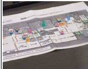
訓練で使用した図面

令和3年9月3日、瑞穂消防署は瑞穂福祉会館・瑞穂児童館で火災図上訓練を行いました。 訓練には福祉会館の職員と児童館の職員が混合で参加し、火災発生時の初動対応能力向上を目的として行いました。設置されている消防用設備の仕組みや使用方法等の確認をすることができ、有意義な消防訓練となりました。