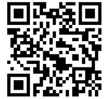
消防訓練実施一覧（令和3年度）