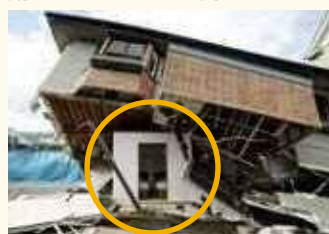
耐震シェルター・防災ベッドの一例

▷地震で住宅が倒壊しても、寝室や睡眠スペース等に安全な空間を残すことで、命を守る装置のことです。安全な空間は、睡眠スペース周りに限られますが、短期間での設置が可能で、費用も抑えられます。