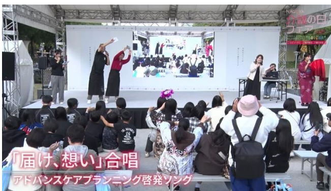
「届け、想い」合唱 アドバンスケアプランニング啓発ソング