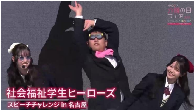
社会福祉学生ヒーローズ スピーチチャレンジ in 名古屋