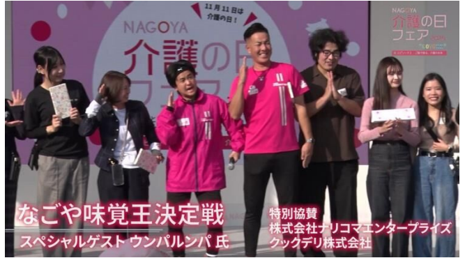
なごや味覚王決定戦 スペシャルゲスト ounpampa 氏 特別協賛 株式会社オリコムエンタープライズ クックデリ株式会社