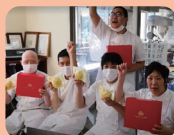
わーくす昭と橋 (名古屋市)