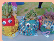
生活介護 来夢 (豊明市)