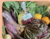
ちよだふあ〜む (あま市)