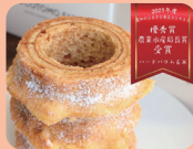
ココモワークス犬山 (犬山市)