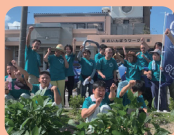
れいんぼうワークス (愛西市)