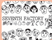
セブンス・ファクトリー (日進市)