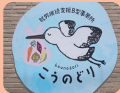
こうのどり (碧南市)