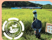
シンシア豊川 (豊川市)