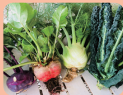
ステップワークスIWASAKI (豊橋市)