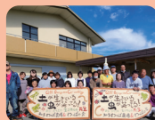
わっぱ知多共働事業所 (武豊町)