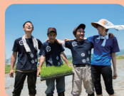
むもんカンパニー青い空 (豊田市)