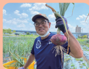
ぼかぼかワークス (名古屋市)