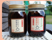
しおみの丘 (みよし市)