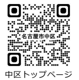
中区トップページ