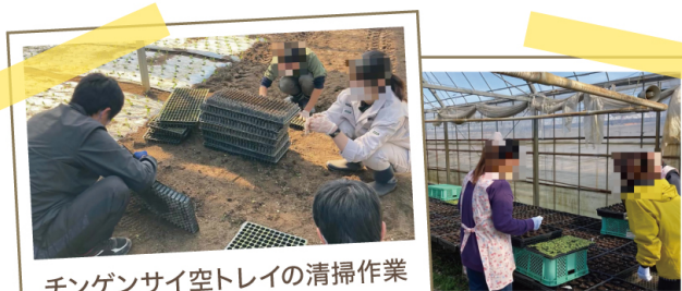
チンゲンサイ空トレイの清掃作業

福祉事業所等に農作業を請け負ってもらう取組です。農業者は労働力不足の解消に、障がいのある方等は生きがいや自信の創出などにつながっています。