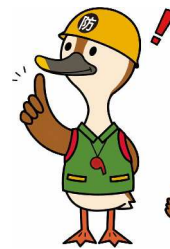
名古屋市防災危機管理局 防災啓発キャラクター クルカモ

災害時の避難に支援が必要な避難行動要支援者一人ひとりの「どこに避難するか」「誰が支援するか」等を記載した計画です。地域の災害特性やご本人の心身の状況をあらかじめ関係者で共有し、計画を事前に作成することにより、適時適切な避難行動につなげていくことを目的としています。